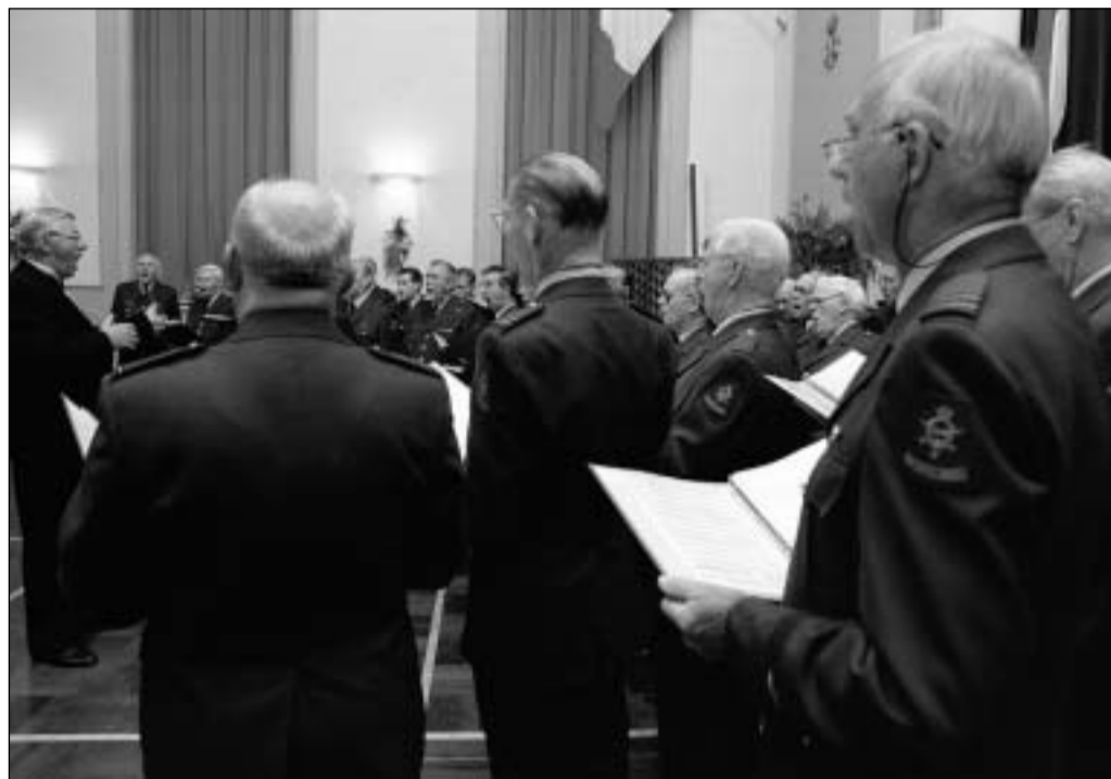
Het Luchtmacht Mannenkoor zingt tijdens 50-jarig jubileum van het van Weerden-Poelmanfonds.